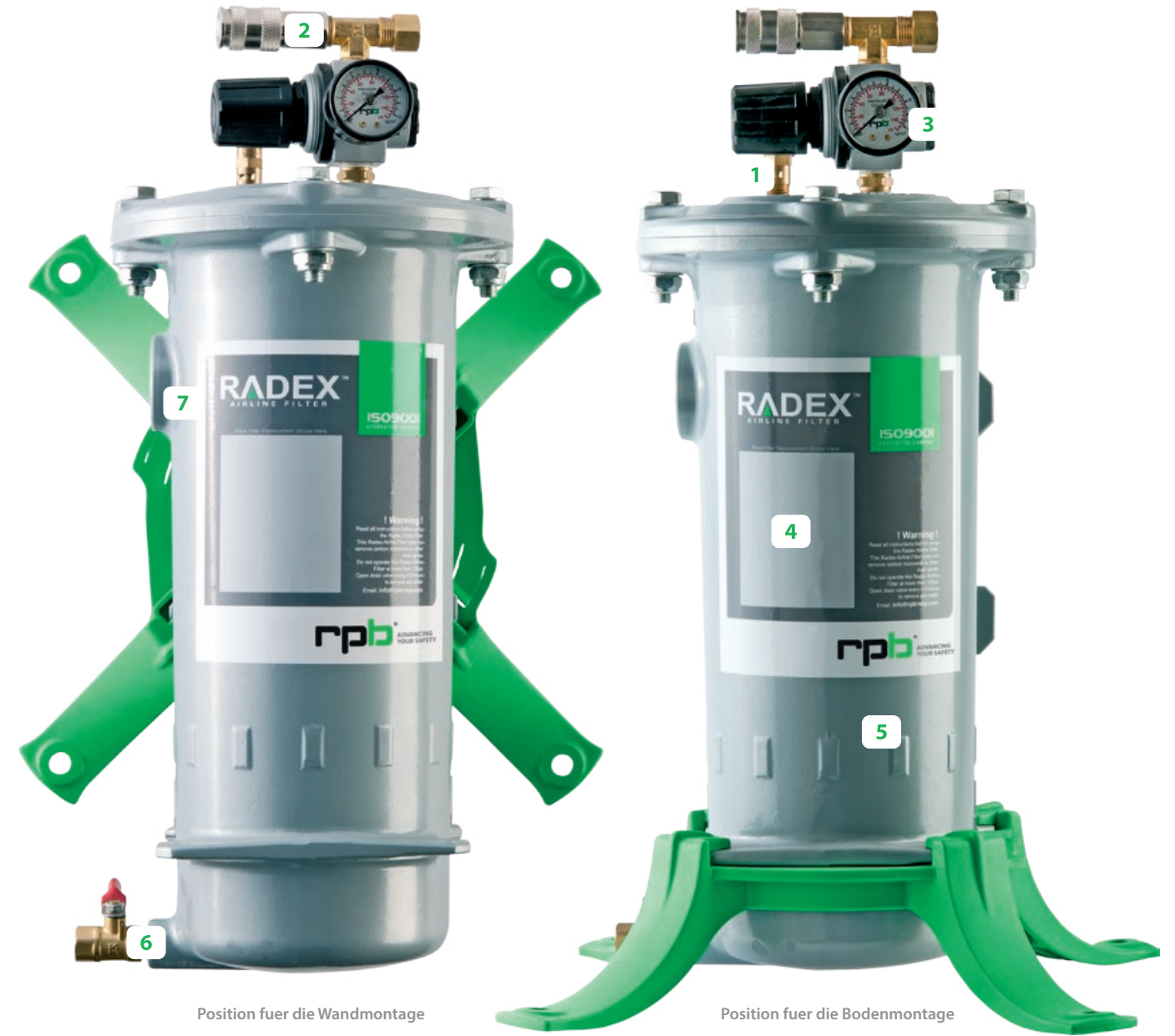
Position fuer die Wandmontage