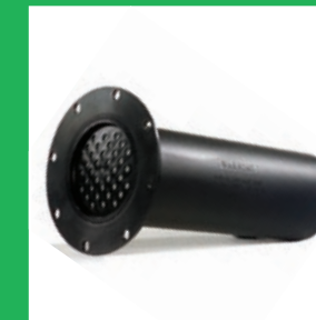
6 Stufen Filtereinsatz